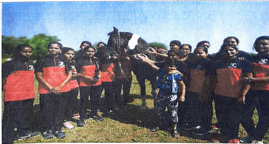
Horse Raiding on 28 November, 2020